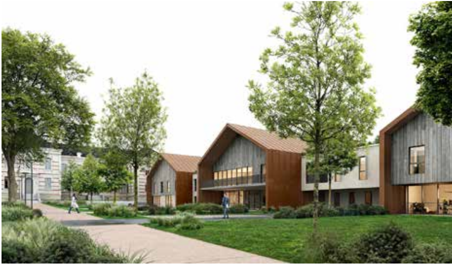
▲ Vue d'architecte du projet retenu pour la création du nouveau pôle santé.