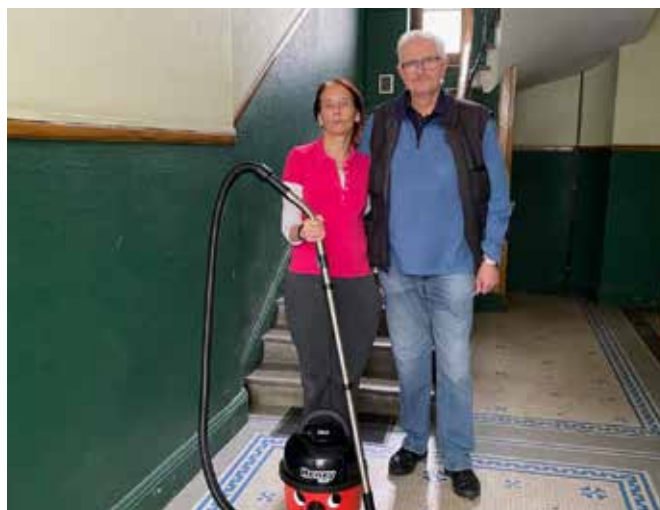
▲ AS Nettoyage, au service des pros et des particuliers.