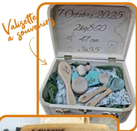
Valisette à souvenirs

Ouvert du mardi au vendredi de 10 h 30 à 13 heures et de 15 h 30 à 19 heures et le samedi de 10 h 30 à 12 h 30 et de 15 heures à 18 h 30. Fermeture le jeudi.