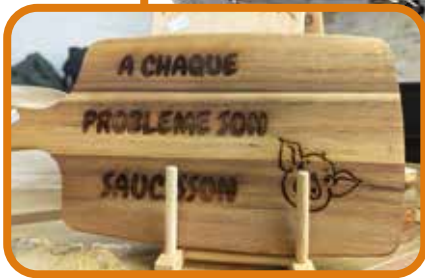
Planche et miroirs de poche personnalisés