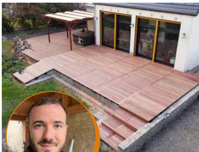
▲ Exemple d'une réalisation récente.