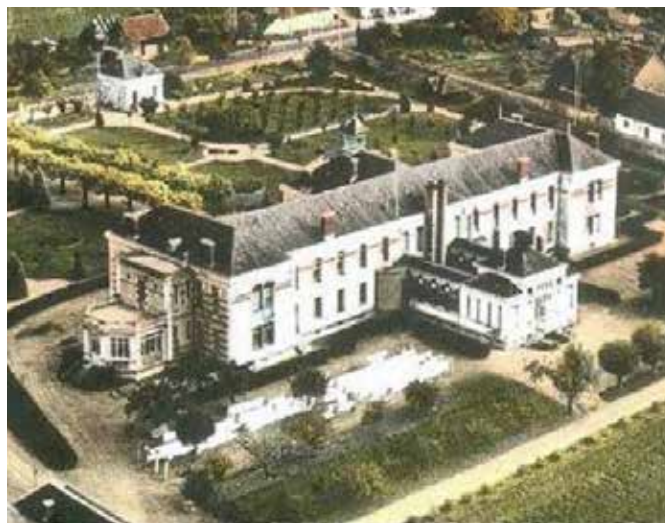
L'imposant bâtiment a été inauguré en 1904.