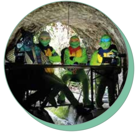
▲ Si vous croisez des Tortues Ninja dans le Val de Sioule, il y a des chances que ce soit les membres de la Carapace.

Solidarité, entraide et soutien aux personnes précaires sont au centre des valeurs portées par des habitants. Avec la Carapace, ils veulent protéger les plus démunis en leur apportant un toit et un lieu sécurisant et ouvert sur les autres.