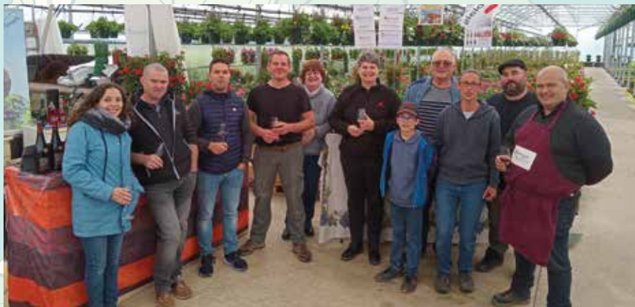
▲ Les viticulteurs de plusieurs régions et le chef du restaurant l'Épicurien proposeront des dégustations les 2 et 3 mai prochains.