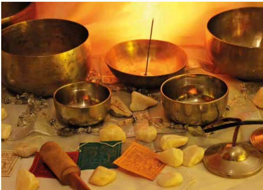
▲ Parmi les stands, découvrez les bols tibétains.

Une quarantaine d'exposants seront présents durant les deux jours. Cette année, le comité des fêtes se réjouit d'organiser sa manifestation sur son territoire et, qui plus est, au Belvédère entièrement rénové (voir notre article dans Agadon! n° 7). C'est donc dans un espace flambant neuf et propice à la détente, avec