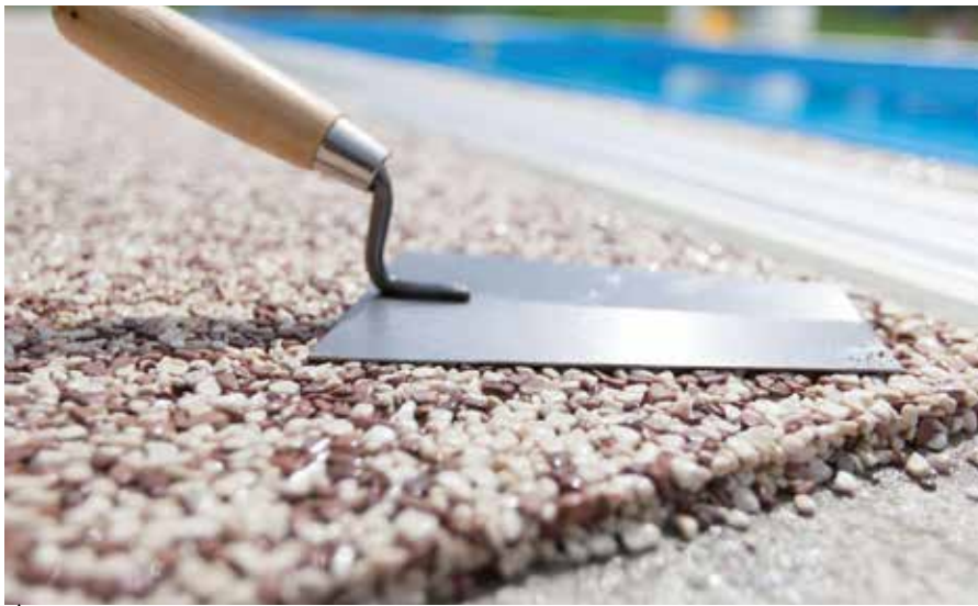
▲ La moquette de pierre convient autant à l'extérieur qu'à l'intérieur et offre un rendu original.