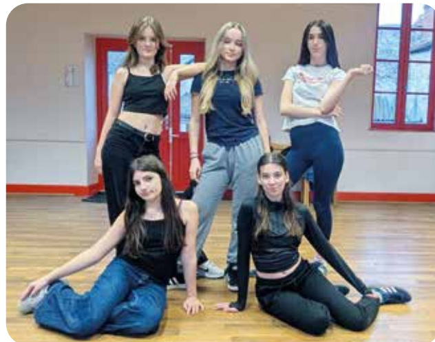
* Les Pink Devils étaient six originellement.

Si vous souhaitez les rejoindre, vous pouvez contacter Margaux au 07 87 00 77 23. Cotisation annuelle au Collectif de Bellenaves : 20 €.