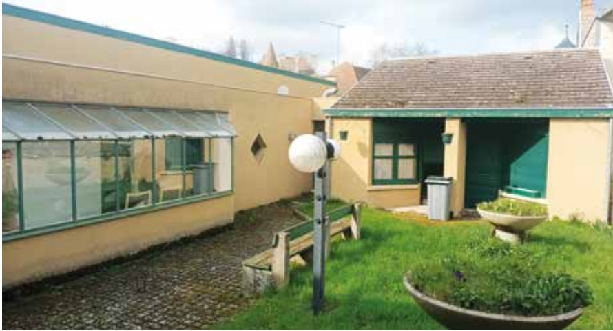
▲ La Carapace a fait l'acquisition de l'annexe du foyer-logements pour créer des logements à vocation sociale et destinés en priorité aux personnes précaires.

Ce n'est pas un secret, le mal-logement existe même à la campagne. Spéculation sur l'immobilier, loyers en hausse, habitats dégradés... Il est souvent bien compliqué de trouver de quoi vivre dignement, et ça l'est encore plus lorsque l'on est précaire avec des situations professionnelles qui ne rentrent pas toujours dans les cases. C'est pour répondre notamment à cette problématique que la Carapace de Bellenaves a été créée en avril 2025.