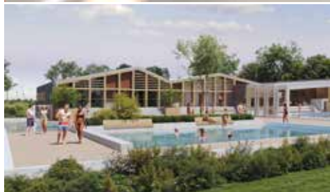
▲ Vues d'architecte du projet de Gannat (en haut) et de Saint-Pourçain. © AGS architecture

L'Aluminosité elmalu par GRANGE DEPUIS 1967