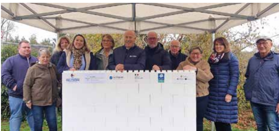
▲ Les élus communautaires ont procédé à la pose symbolique de la première pierre du futur accueil de loisirs à Saint-Pourçain.

Depuis longtemps dans les tuyaux, le projet va enfin pouvoir voir le jour, toujours en centre-ville et à deux pas de la piscine municipale, de la cité scolaire Blaise-de-Vigène et de l'île de la Ronde. Le futur bâtiment s'étendra sur 975 m 2 de plain-pied pour accueillir 120 enfants et une équipe éducative dédiée d'ici fin 2026.